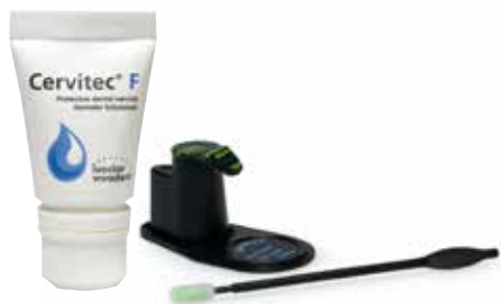
Cervitec F levereras i tub eller singeldos