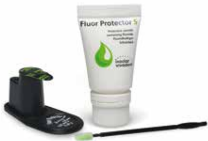
Fluor Protector S levereras i tub eller singeldos