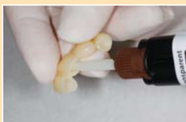
Telio CS Link