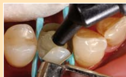
Telio CS Inlay & Telio CS Onlay